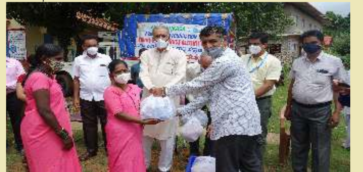
ವಿಧಾನಸಭೆ ಅಧ್ಯಕ್ಷರಾದ ಶ್ರೀ ವಿಶ್ವೇಶ್ವರ ಹೆಗಡೆ ಕಾಗೇರಿ ಅವರಿಂದ ಫಲಾನುಭವಿಗಳಿಗೆ ಅಗತ್ಯ ದಿನಸಿ ಕಿಟ್ ವಿತರಣೆ